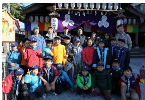
豊中不動尊での記念撮影