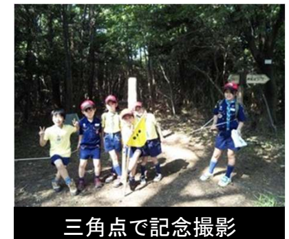
三角点で記念撮影

本当の目的地は六箇山にある三角点。ハート広場には本当の目的地を指示した通信文がありました。ハート広場からは追跡サインが設置しています。スカウトたちは追跡サインに従い、本当の目的地へ向かいます。