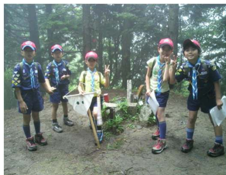
比叡山三角点で記念撮影

ケーブル延暦寺駅から山麓の八幡神社までは山道をひたすら歩きます。この区間になってもどの組も歩くスピードは落ちず、休憩の度に先頭の組が入れ替わるほどの僅差、白熱した優勝争いです。目的地の八幡神社のある町名を調べるのが最後の課題、町名はズバリ「滋賀里」です。そして八幡神社に最初に着いたのは3組、そして2組、1組と続きます。