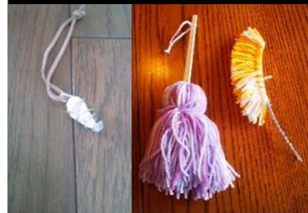
小石のストラップと毛糸のミニモップ