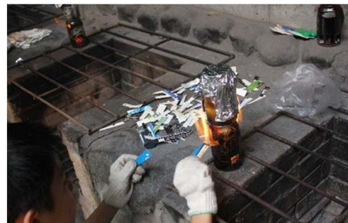
空気穴から炎が噴き出しても ひるまずに燃料をくべます。