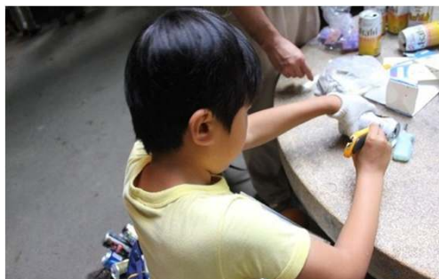
かまどになる空き缶に、 カッターで空気穴を開けます。

二日目の昼食は、空き缶を使った炊飯です。空き缶2個を用意します。まずはかまど作り。かまどとなる空き缶の上下各2箇所にかッターで空気穴を開け、缶切りで蓋を取ります。もう1個の空き缶も缶切りで蓋を取り、米を1合、水を八分目まで入れ、アルミホイルで蓋をします。かまどの空き缶の上に米を入れた空き缶を載せ、牛乳パックを短冊上に切った燃料をどんどんくべて20分炊けば、美味しいご飯が出来あがります。カッターで空き缶を切る時と、炎が噴き出る空き缶のかまどに燃料をくべる時は事故が起こらないか心配しましたが、無事怪我人もなく、スカウトたちは美味しいご飯に大満足でした。