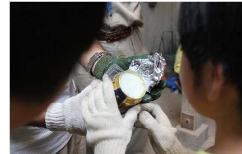
上手な炊き上がり。 ほとんどのスカウトが大成功。