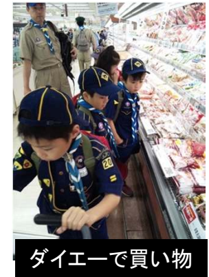
ダイエーで買い物

メニュー … 1組: クリームシチュー、2組: カレーライス、3組: カレー鍋うどん そして組ごとで買い物。ダイエーへ行き、買い物リストに従い食材を買います。