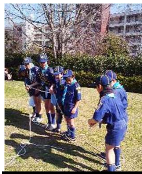
危ない川を渡ろう