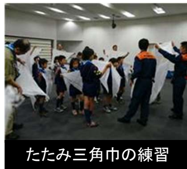
たたみ三角巾の練習