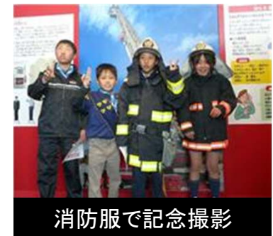
消防服で記念撮影