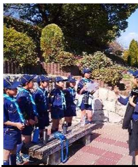
大きな声で歌おう