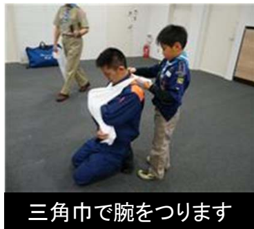
三角巾で腕をつります

昼食後防災学習センターに戻り、今度は防災訓練です。地震の体験や、消火器の使い方を練習します。そして消防指令室と消防車を見学し、消防服を試着します。